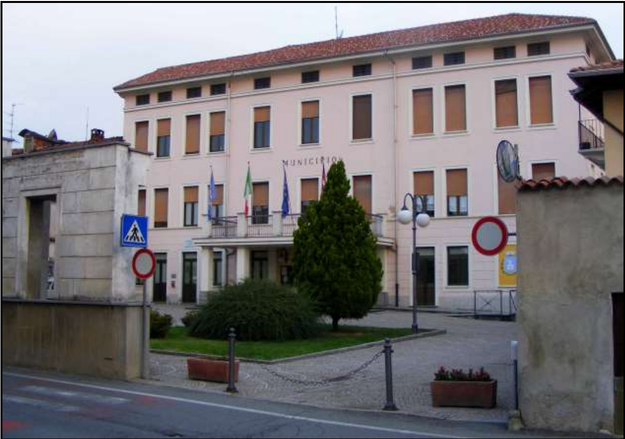
Municipio di Ponderano